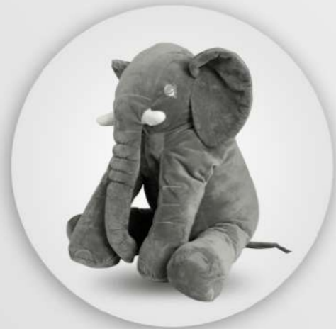
NIÑOS Y BEBÉS